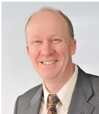
UNEP IETC 所長 キース・アルバーソン

環境技術や経済社会的要因、生産と消費の人間活動の要素等を多角的に分析し、グローバルな廃棄物問題の解決を実施している国連の廃棄物担当部門。